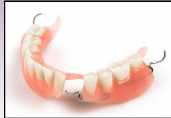
GIGI PALSU SEPARUH