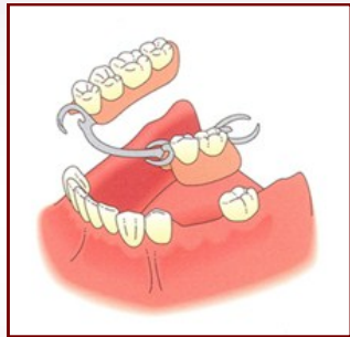
GIGI PALSU / DENTUR