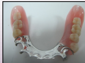
GIGI PALSU KROM-KOBALT