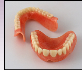
GIGI PALSU PENUH